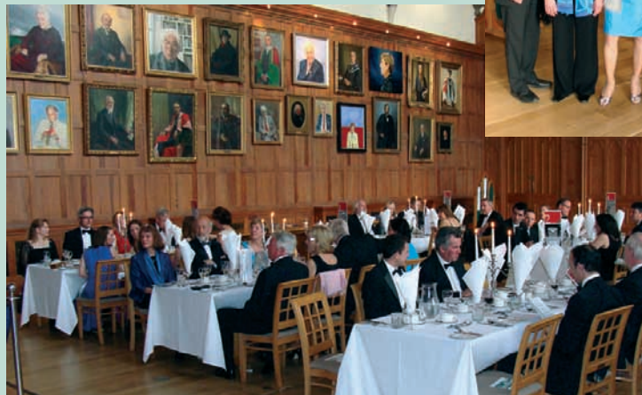
LINKS: Beim Charity Dinner at Queens