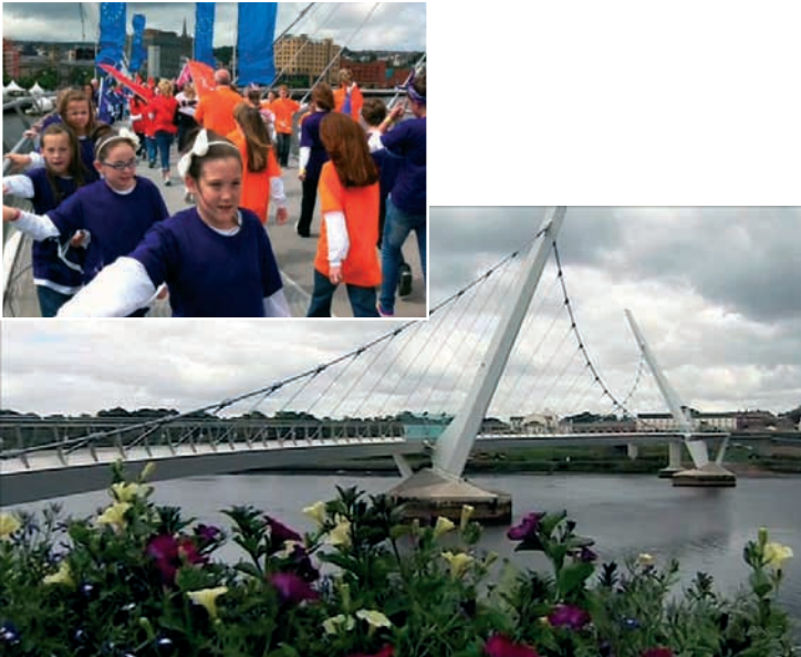
312 Meter lang und 14,6 Mio. Euro teuer: Derrys Brücke über den Foyle

Die wie ein 'S' geformte, 14,6 Mio. Euro teure Brücke – Derrys dritte über den Foyle – ist insgesamt 312 Meter lang. 600 Schulkinder aller Konfessionen sangen einen eigens dafür komponierten Song zur Eröffnung der Brücke. Martin McGuinness gab seiner Hoffnung Ausdruck, daß die Brücke ein Zeichen für Veränderung setzen werde; während First Minister Peter Robinson dem irischen Taoiseach Enda Kenny und dem EU-Kommissar Johannes Hahn für ihr nachhaltiges Engagement bei der Durchführung dieses Projekts dankte. Das Peace III Programm der EU steuerte maßgeblich zur Finanzierung des Bauwerks bei. Aus der Vogelperspektive gesehen, sieht die für Fußgänger und Radfahrer ausgelegte Brücke aus wie eine stählerne Schlange. Ihr Bau benötigte 18 Monate. Wilkinson Eyre Architects, die für das Design verantwortlich sind, haben auch die Gateshead Millennium Bridge über den River Tyne entworfen.