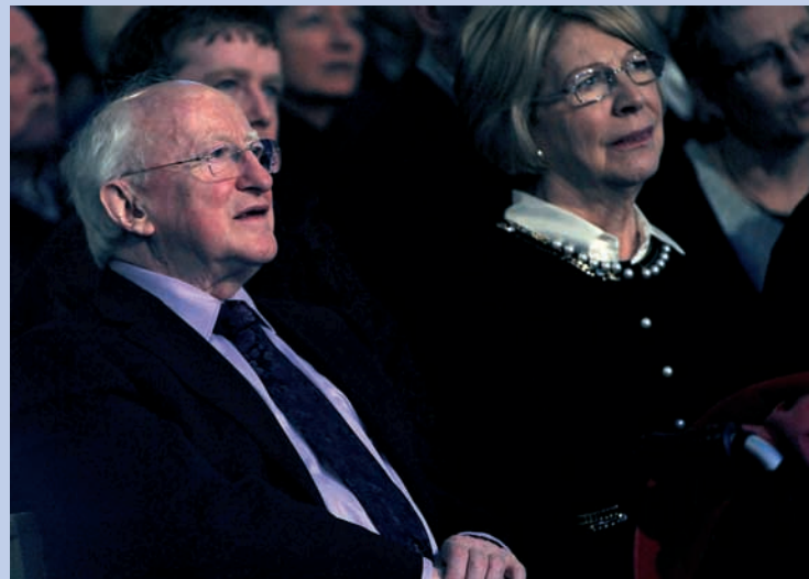
Temple Bar TradFest: der Staatspräsident beim Jubiläumskonzert der Dubliners in der Christchurch (Siehe auch ab Seite 54).