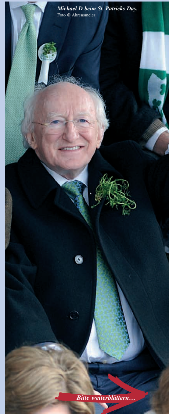
Michael D beim St. Patricks Day.