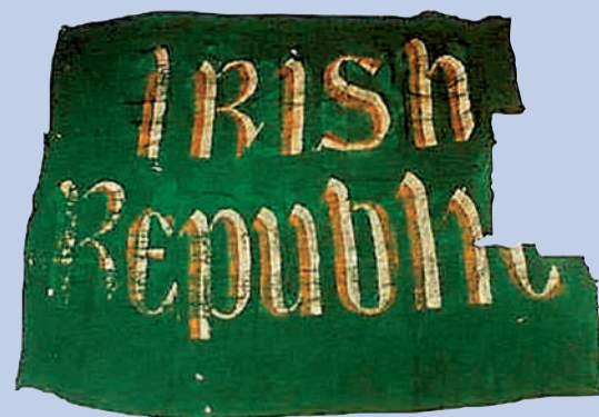
Connollys Flagge, die 1916 über dem Hauptpostamt in Dublin wehte.

Die wahre Republik steht für Michael D Higgins an erster Stelle der Prioritäten seiner Dienstzeit im Áras an Uachtaráin, gefolgt von den komplementären Themen inklusiver Bürgerrechte und Bürgerbeteiligung, der kre-