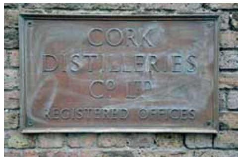
Die Cork Distilleries entstanden 1867, mit Sitz in Midleton .

Gern getrunken wurde John Jamesons Whiskey seit dem Ende des 18. Jahrhunderts. Er genoss stets einen sehr guten Ruf. Nach 1900 schlitterte allerdings die Dubliner Jameson & Son Distillery in eine teilweise selbstschuldete Krise, die bis in die 1970ziger Jahre reichen sollte. Ursachen waren das sture Festhalten am traditionellen Irish Pot Still (ein Whiskey aus nicht gemälzter und gemälzter Gerste), die Erfindung der Coffey Patent Still , die Ablehnung der Grain-Whiskies und damit der Blended Whiskies , die Abspaltung Irlands vom Vereinigten Königreich, der damit verbundene Verlust der Märkte, die amerikanische Prohibition, die Weltkriege, die hohen Alkoholsteuern und die Hinwendung der Iren zum günstigen Bier. Eine Summe von Faktoren bewirkte, dass es nach 1950 lediglich acht Brennereien auf der Emerald Isle gab: Bushmills , Coleraine , Comber , Jameson & Son , John Locke , Midleton , Power & Son und Tullamore . Die glorreiche Zeit irischer Destillationskunst war nur noch eine wehmütige Erinnerung. 1835 hatten 93 Brennereien die Welt mit 50,2 Millionen Litern „Wasser des Lebens“ überschwemmt.