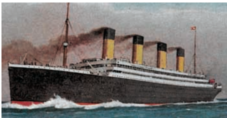
Die 'Titanic' sank am 15. April 1912.

Der Stapellauf von der Harland & Wolff-Werft in Belfast war bereits im Frühjahr 1911, aber die luxuriöse Innenausstattung des Ozeanriesen beanspruchte ein weiteres Jahr. Am 2. April 2012 dann stach die 'Titanic', der weltgrösste 'Ocean-Liner', in See. Letzter Hafen: Cobh. Dann nahm sie Kurs auf New York. Doch sie kam nie dort an. In der Nacht vom 14. auf den 15. April rammte sie einen Eisberg – und das "unsinkbare" Schiff versank in den Fluten. Mehr als 1500 Menschen fanden den Tod im eiskalten Wasser des Atlantiks.