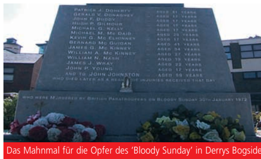
Das Mahnmal für die Opfer des ‘Bloody Sunday’ in Derrys Bogside

Am letzten Januarsonntag gedachte man in Derry der Ereignisse vor 40 Jahren, als am 30. Januar 1972 – am ‘Bloody Sunday’ oder ‘Blutsonntag’ – ein Bürgerrechtsmarsch von britischen Fallschirmjägern unter Feuer genommen wurde und 14 Demonstranten auf der Strecke blieben.