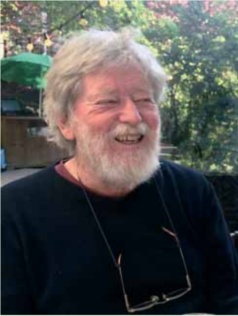
EB im August 2017

Studenten ihre ersten schriftstellerischen Versuche, Gedichte, Essays, Rezensionen, auch Graphiken veröffentlichen. An den von ihm ins Leben gerufenen Bar-Abenden durften die Studenten – ermuntert durch das ein oder andere Glass Guinness - ihre Deutschkenntnisse ausprobieren und verbessern.